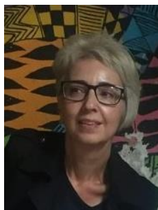
de Silvia Iliescu

Așezat pe valea Izei, Ieudul este un sat cu o istorie foarte veche. În secolul al XIV-lea era domeniul lui Balc, urmașul voievodului Dragoș, întâiul descălecător al Moldovei. La Ieud, în Maramureș, se afla centrul puterii sale; aici au rămas și urmașii lui, Băleștii, care au străbătut veacurile până astăzi. Ei au ridicat în secolul al XVII-lea Biserica din Deal, o minunată construcție din lemn cu picturi interioare, astăzi cea mai veche din țară.