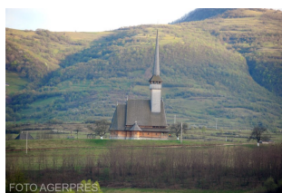
Manastirea 'Sf. Trei Ierarhi' din Ieud.

Dedicăm următoarele trei episoade povestirilor sale uimitoare despre familia Băleștilor și despre epoca pe care a trăit-o.